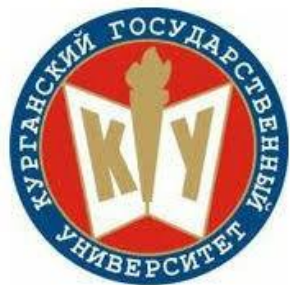
Курганский государственный университет