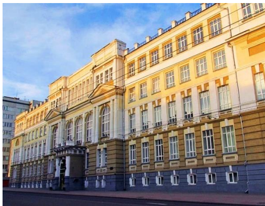
Рисунок 1 – Курский государственный университет

Чертежи, графики, схемы и диаграммы, помещаемые в отчёте, должны соответствовать требованиям стандартов ЕСКД. Величины осей графика должны быть подписаны наименованием величины и её обозначением («Температура, К»).