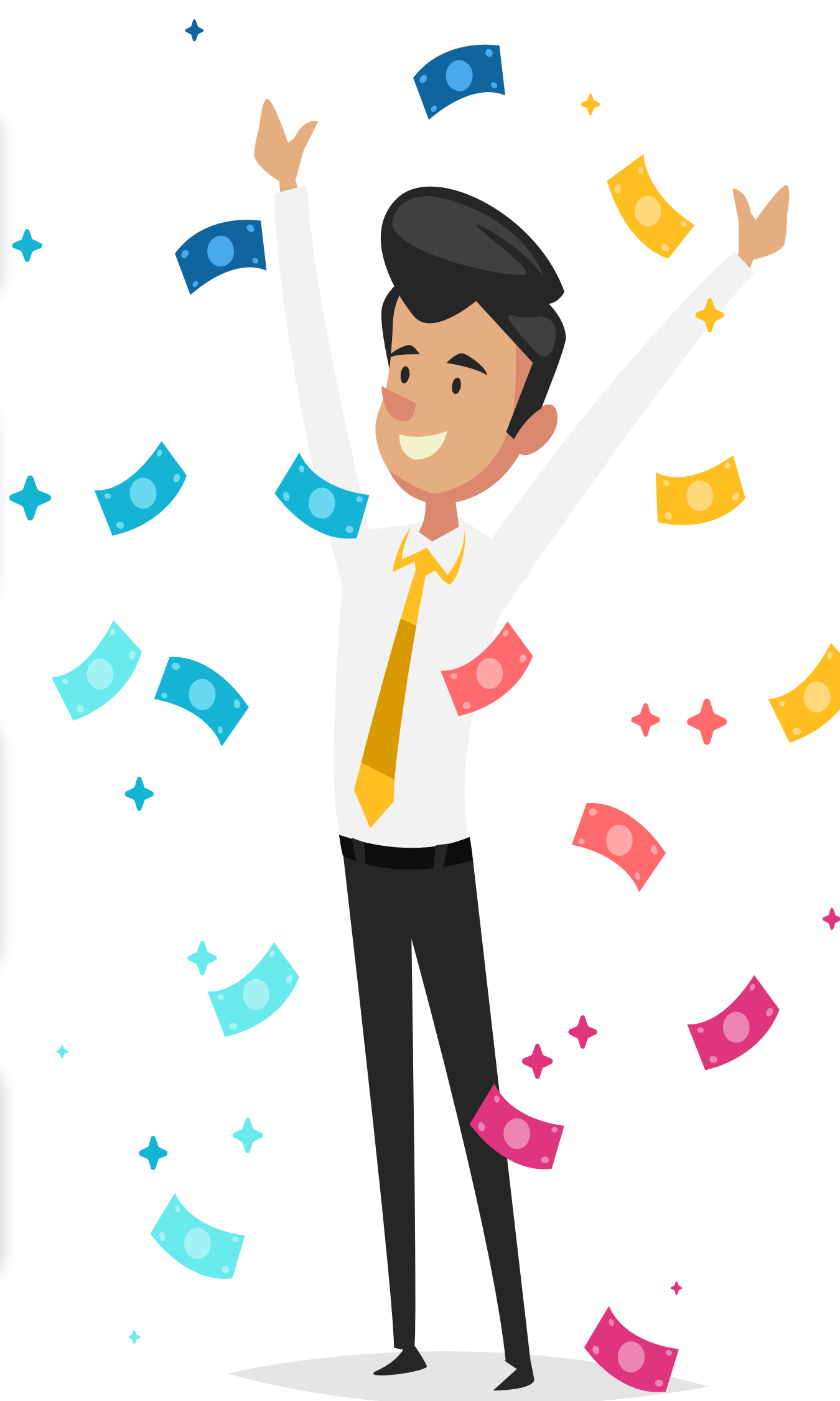
Достоинства и недостатки цифрового рубля