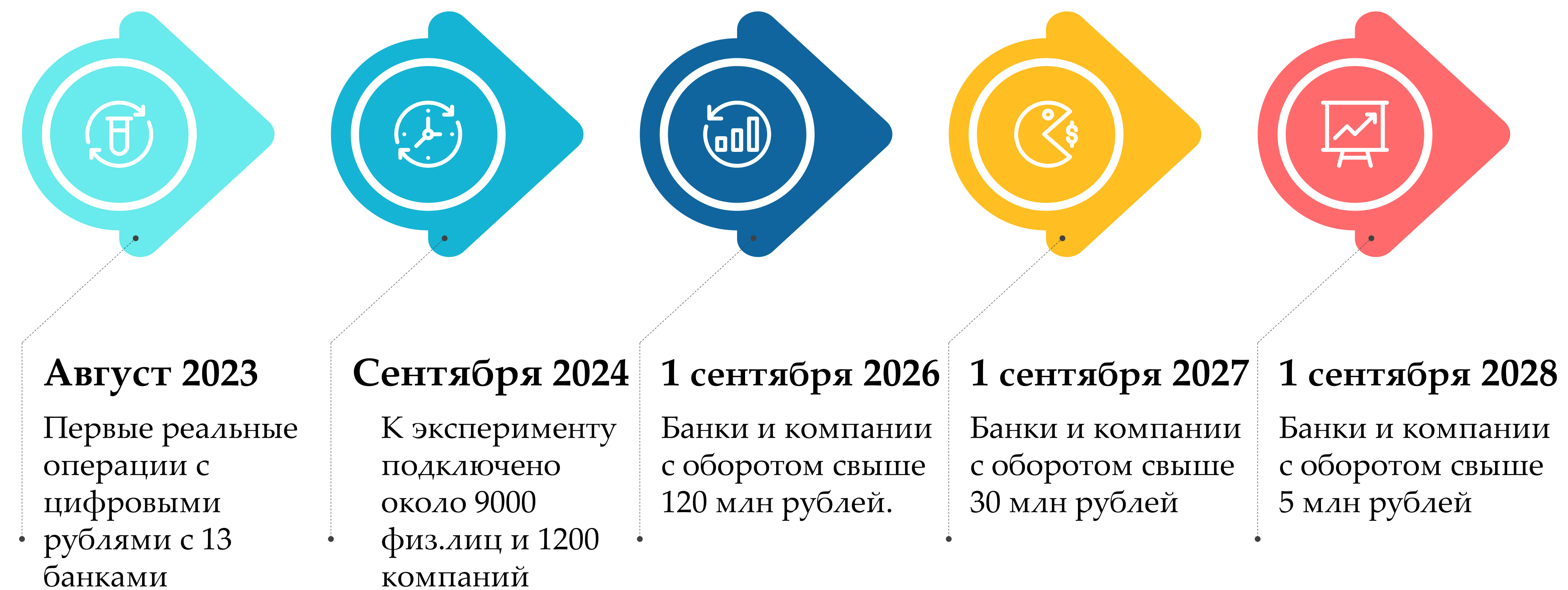
Этапы внедрения цифрового рубля